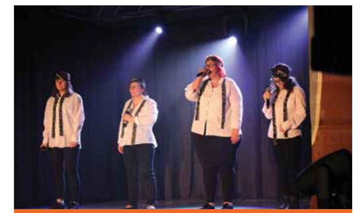
Bravo aux artistes et aux membres de l'association pour leur investissement.

Près de 250 spectateurs ont assisté à ce spectacle et sont repartis enchantés.