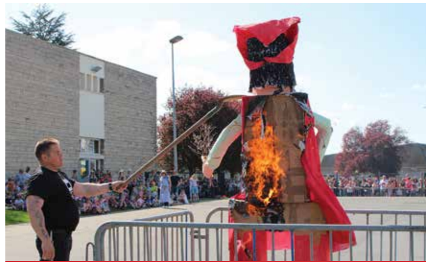
Mademoiselle Printemps a fait des étincelles

Ainsi escargots, coccinelles, abeilles et hérissons étaient de sortie afin de nous apporter le beau temps !