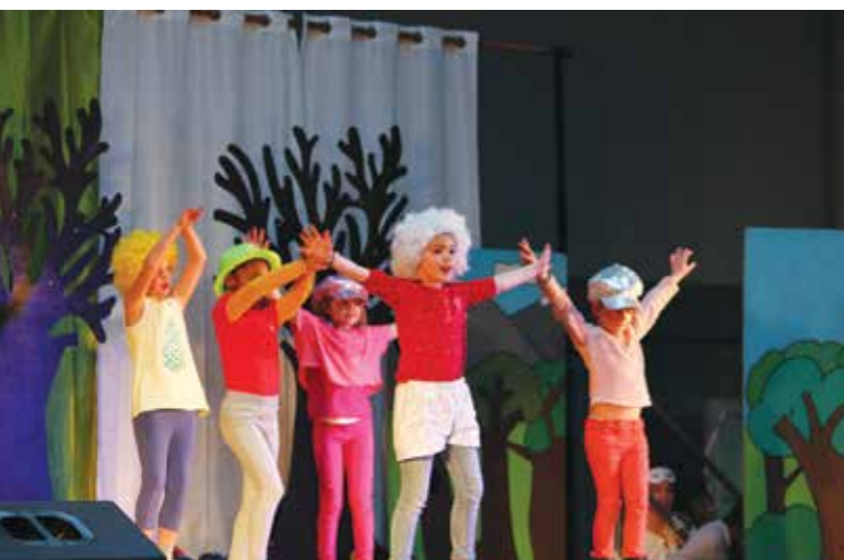
La dernière fête des Nouvelles Activités Périscolaires

L'an prochain il n'y aura plus de NAP, mais il y aura toujours des enfants, des Temps Educatifs et l'envie irrésistible de revivre de telles fêtes. Merci à tous les animateurs pour leur investissement et leur bonne humeur.