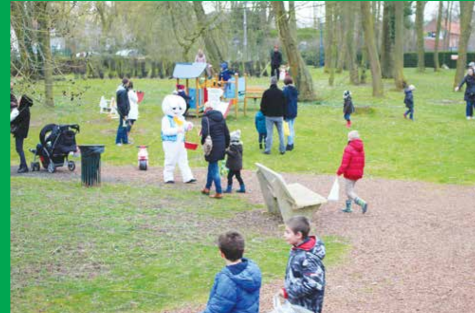
Chasse à l'oeuf - Avril