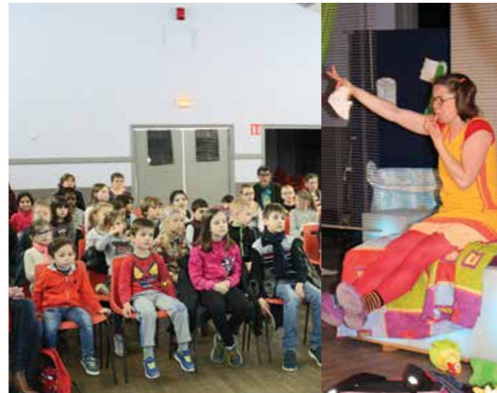
Les enfants ont rencontré Annette la Chipette...