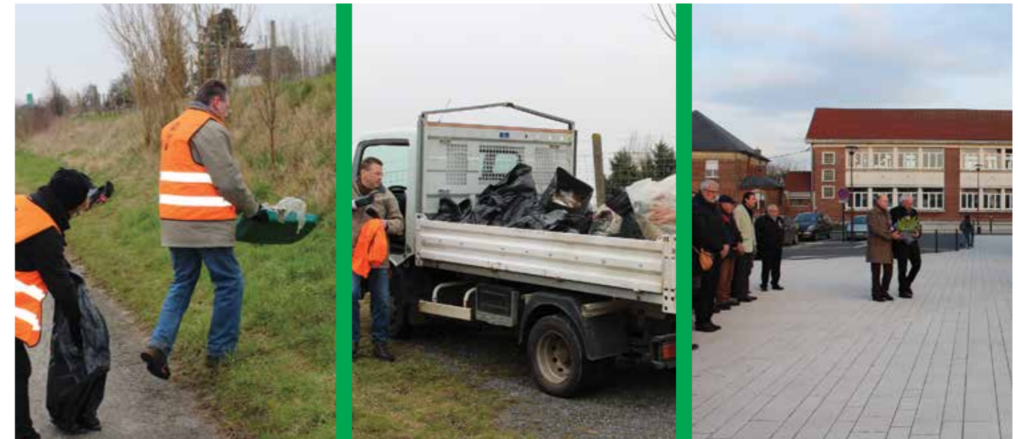
Opération ville propre - Mars