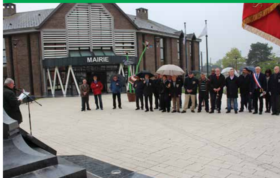
Journée de la Déportation - Avril