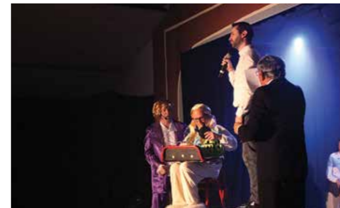
Euch téléphone y brait.. Et le public avec...