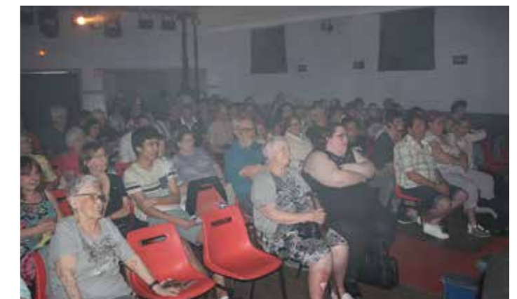
Un public toujours aussi nombreux...

Les 21 et 22 avril salle Jordan Dellacherie, l'association «Talents en scène» a présenté sa nouvelle création : «les Talents retournent la télé».