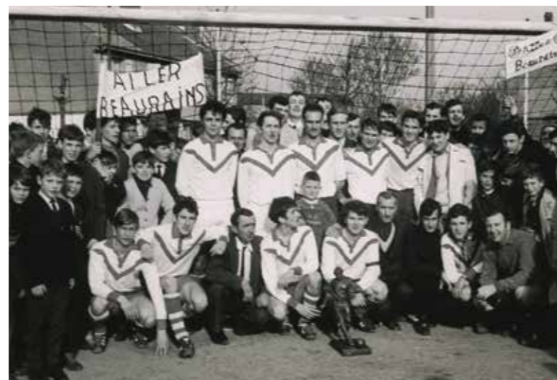
Le club de football de Beaurains en 1968...