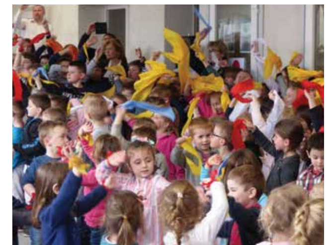
La chorale des écoliers

Un grand merci à tous pour ce magnifique travail.