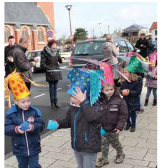
La fête des petits... et les paparazzis sont de sortie !

Le défilé les a tout d'abord amenés dans la cour de l'école. Les élèves ravis se sont ensuite dirigés vers la ville. La joie du carnaval a entraîné tout le monde dans une belle fête. Ce partage avec le personnel enseignant fut un moment riche en couleurs et en jeu.