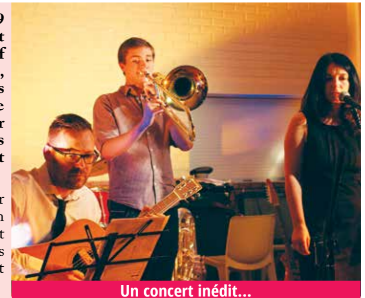
Un concert inédit...

Ces travaux de rencontre ont une grosse valeur pédagogique, chacun présente son instrument en jouant un titre ou un extrait musical. La soirée s'est clôturée par « Everybody needs somebody » des blues Brothers avec cuivres, guitares, contrebasse, chant et batterie !