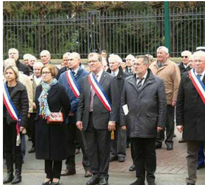
Congrès des Anciens Combattants - Mars