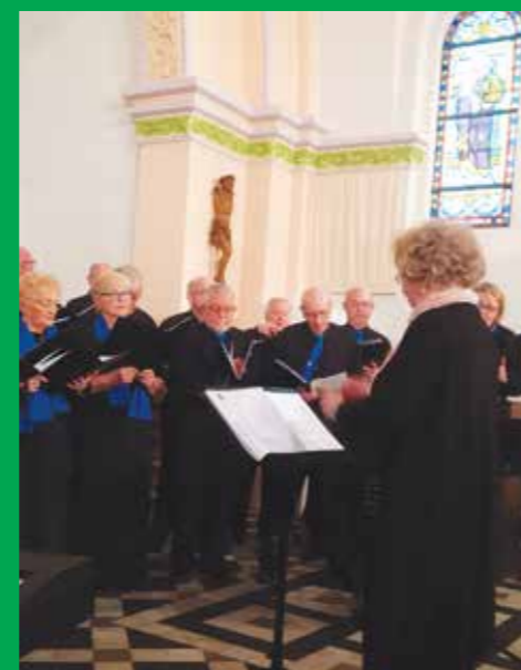
Concert des Orphéonistes - Avril