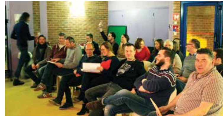
Partager nos connaissances pour mieux agir

Les Ateliers des Musiques Actuelles ont organisé leur 3 e «blind test» le jeudi 22 mars au centre social Chico Mendès. Le terme « blind test » signifie « test à l'aveugle » en anglais. Cela permet de faire parler amateurs et néophytes ou passionnés sur la diversité de la musique tout en partageant un moment de convivialité.