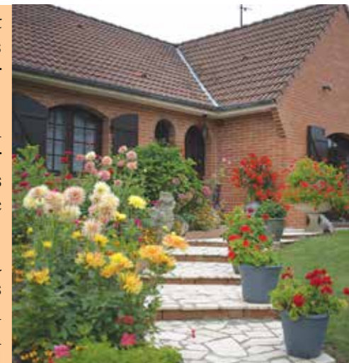
En 2017, M. Gondek Jean a remporté le concours des maisons fleuries

Si vous souhaitez participer à ce concours, nous vous invitons à vous inscrire jusqu'au 20 juin 2018 en retournant ce coupon en Mairie de Beurains - Accueil - 1, Place de la fontaine BP 90027.