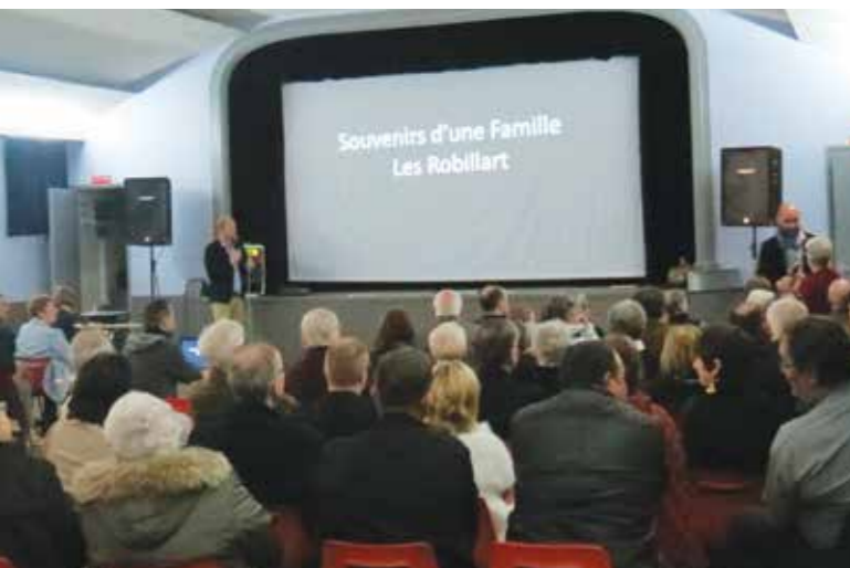
«Je suis venu en pensant que ça allait être «scolaire» et j'ai passé un excellent moment !»

émotions variées avec le rire et les souvenirs. Les vingt-cinq membres de la joyeuse équipe préparent un recueil pour la fin d'année. Il sera co-écrit avec les élèves d'une classe de cours moyens. «L'idée est de croiser la mémoire de trois générations pour évoquer notre ville» explique l'animateur du groupe. Un projet partagé pour transmettre et... recevoir. Prochain rendez-vous le dimanche 16 décembre à la salle Jordan Dellacherie.