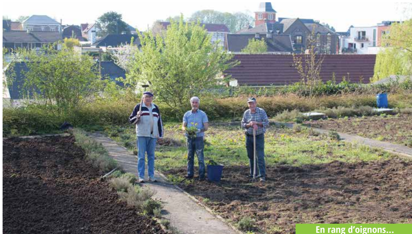
En rang d'oignons...

elles apparaîtront sur les tables de ces magiciens de la nature. Les jardins communaux. Ce sont 37 parcelles, 11 rue Victor Hugo, 6 Hameau des Œillettes et 20, Théâtre de verdure Duquesnoy. Une parcelle est réservée aux jardins partagés du centre social, pour la plus grande joie des enfants.