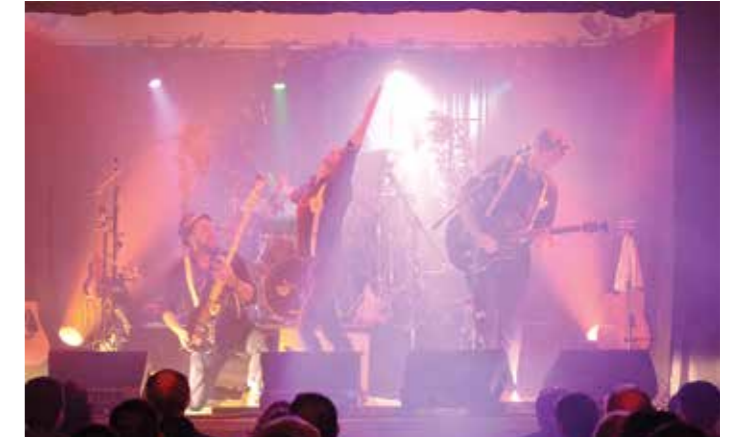
Les singes musiciens sont de retour...

Si vous les avez manqués : AROKANA fête ses 10 ans le 24 Novembre 2018 20h30 au Stade couvert de Liévin