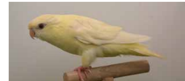
Catherine, la perruche qui vaut de l'or

Enfant, ses parents ont installé leur « nid » à Beaurains, pour un anniversaire un couple de