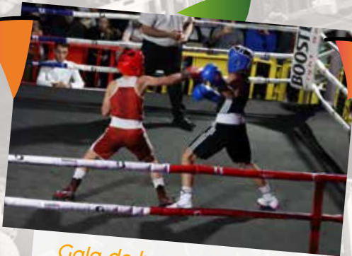
Gala de boxe organisé par le "boxing club de Beaurains"