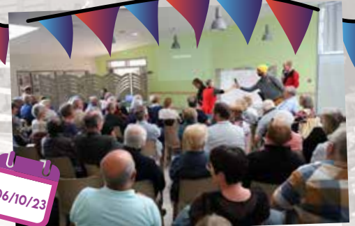
Si Beaurains m'était conté de "Beaurains mémoire"