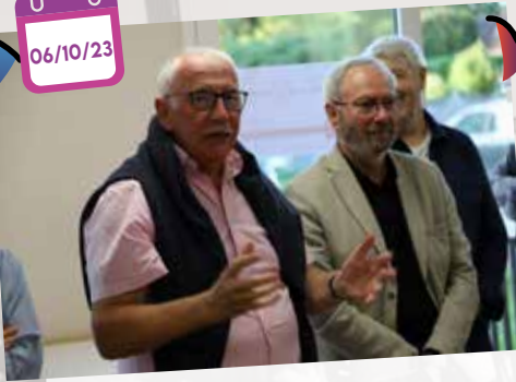
Inauguration des nouveaux locaux de l'association "Création & Savoir-faire"