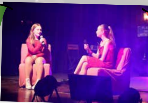
Spectacle "Talents en scène" fait son show