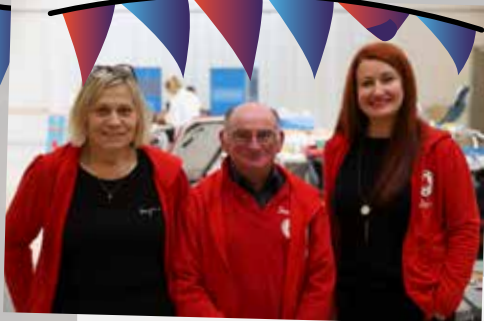
Don du sang organisé par "Beaurains sang pour sang" en partenariat avec l'EFS