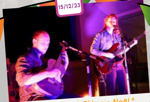
Scène ouverte "Ch'gran Noël".